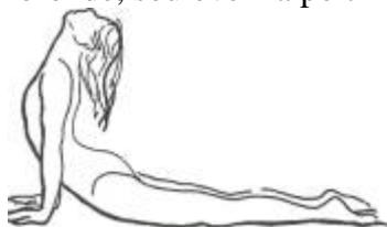
Figure 1. Le serpent

Allongez-vous sur le ventre, les paumes des mains sur le sol au niveau des épaules, les coudes posés, En prenant une inspiration profonde, soulevez la poitrine jusqu'à avoir les coudes tendus.