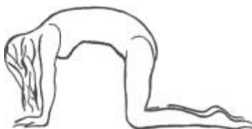
Figure 2. Le chat

Mettez-vous à genoux, les mains sur le sol devant vous, les coudes tendus. Arrondissez le dos au maximum, comme un chat, en rentrant la tête et les épaules. Miaulez comme un chat si vous en avez envie. Puis relâchez le dos, en le creusant le plus possible, la tête et les épaules levées. Là, ronronnez comme un chat Recommencez.