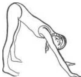
Figure 3. Le chien

Allongez-vous sur le ventre, les paumes des mains sur le sol à côté de la taille. Les jambes doivent être légèrement écartées, un peu plus que de la largeur des hanches, les orteils repliés et pressés contre le sol, les talons levés. Inspirez et poussez avec les mains et les pieds Jusqu'à ce que votre corps prenne une forme de V retourné. En expirant, plaquez vos talons au sol et alignez la tête avec le dos. Grognez comme un chien ! Revenez sur le sol et reposez-vous. Recommencez.