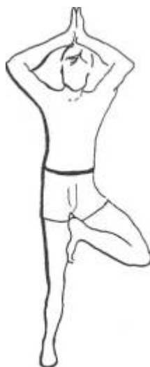
Figure 5. L'arbre

Mettez-vous debout, bien droits, les deux pieds serrés. Choisissez un point sur le mur en face de vous. Assurez-vous qu'il est immobile et concentrez-vous dessus : il vous aidera à garder l'équilibre. Levez votre pied gauche et placez-le juste au-dessus de votre genou droit, en ouvrant le genou gauche sur (e côté. Levez lentement les bras au-dessus de la tête en gardant les paumes des mains pressées l'une contre l'autre. Inspirez et expirez lentement. Tendez un peu plus les bras et abaissez les épaules- Inspirez et expirez de nouveau. Sentez-vous calme comme un chêne fort et robuste. Inspirez puis, en expirant, baissez lentement les bras et la jambe. Recommencez avec l'autre jambe.