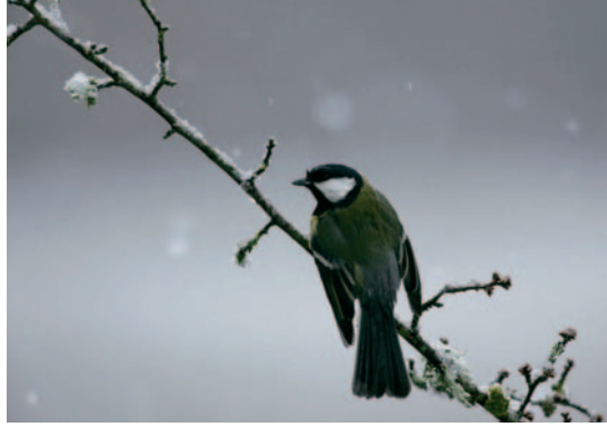
Mésange charbonnière. Le fond fait ressortir l'oiseau et les flocons. Pour que la pluie ou la neige se voie, l'arrière-plan doit être foncé.

Pour des petits mammifères (lapins ou marmottes), allongez-vous et posez l'appareil sur un sac de calage ou sur un vêtement. Les pieds photo qui permettent de descendre très bas conviennent aussi dans ces situations. Pour des animaux évoluant dans les arbres comme les écureuils, les oiseaux forestiers ou des oiseaux en vol, il est parfois nécessaire de se placer à plusieurs mètres du sol. Il faut alors rechercher un arbre ou un point surélevé. S'il n'y en a pas, vous pouvez avoir recours à un affût construit sur une armature de quelques mètres.