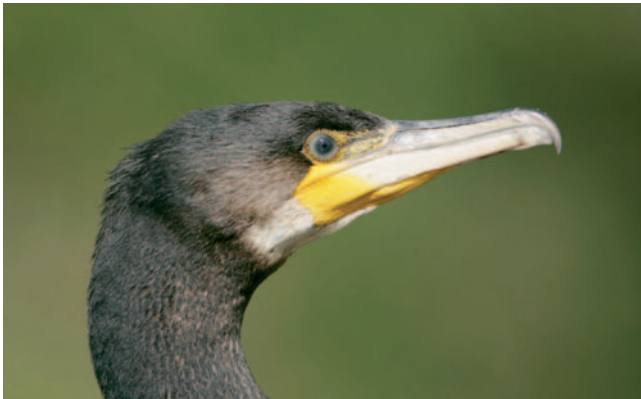
Cormoran de profil. La faible profondeur de champ ne pose pas de problème puisque le sujet photographié est presque plat et parallèle au plan film.

En revanche, avec des petits animaux peu craintifs comme les hérissons ou les crapauds, le grand-angle permet de réaliser des images originales. Fermez alors le diaphragme pour obtenir une grande profondeur de champ. Si votre appareil dispose d'un testeur de profondeur de champ, vous pourrez visualiser directement le résultat final.