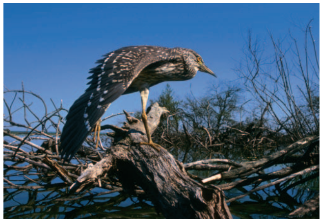
Héron bihoreau sur des arbres morts, lac de Grand Lieu. Je voulais que le décor apparaisse ; le grand-angle a permis une grande profondeur de champ.

Il est parfois intéressant d'inclure à la composition des éléments du décor : un arbre mort à la forme graphique ou une roche couverte de lichens. Lorsque vous avez la possibilité d'intégrer un détail esthétique ou informatif dans vos photos, il ne faut pas hésiter. Il faut même de temps en temps privilégier un objectif moins puissant, voire un grand-angle, quand le lieu où se trouve l'animal offre des possibilités de cadrage intéressantes. Parfois, il suffit juste de prendre la photo de plus loin. Cela peut être intéressant avec des animaux craintifs, car plus la