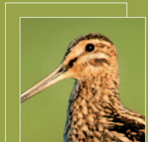
Bécassine des marais se reflétant à la surface de l'eau.

En photographie animalière, il faut composer avec un sujet qui bouge, une luminosité faible, un décor incontrôlable... Un rapide tour d'horizon des techniques de base appliquées à la prise de vue d'animaux vous aidera à régler votre boîtier et exposer correctement vos photos selon les situations, ou à composer vos images en milieu naturel.