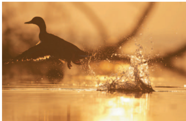
Pour figer ce canard colvert au décollage, il fallait une vitesse très rapide (1/800 s).

Pour les photographies réalisées à main levée, la capacité à stabiliser le boîtier dépend de chacun mais surtout de la focale utilisée. Plus elle est longue et plus les risques de flou sont importants. Les gros télé-objectifs utilisés pour la photo d'animaux (300 à 500 mm) nécessitent