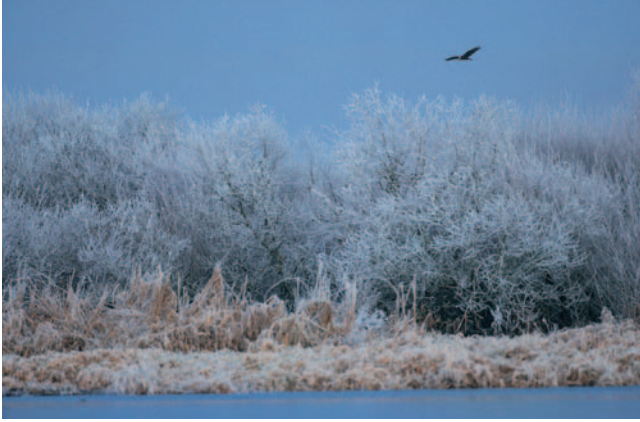
Busard des roseaux survolant un marais givré.

distance entre l'affût et l'animal augmente, plus grandes sont les chances de voir venir le sujet.