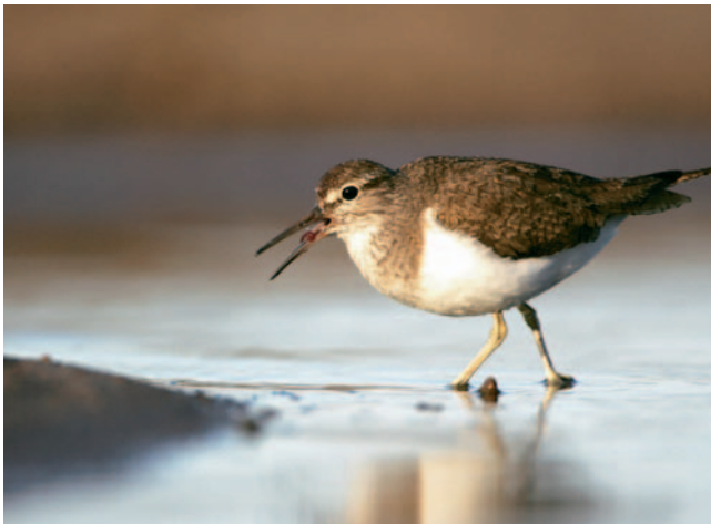
Chevalier guignette. Cet oiseau ne dépasse pas 15 cm. Pour être à sa hauteur, j'ai appuyé mon matériel sur un sac posé au sol.

Un grand-angle amplifie l'effet de perspective donné par un point de vue au ras du sol ; il doit posséder une distance minimale de mise au point suffisamment courte.