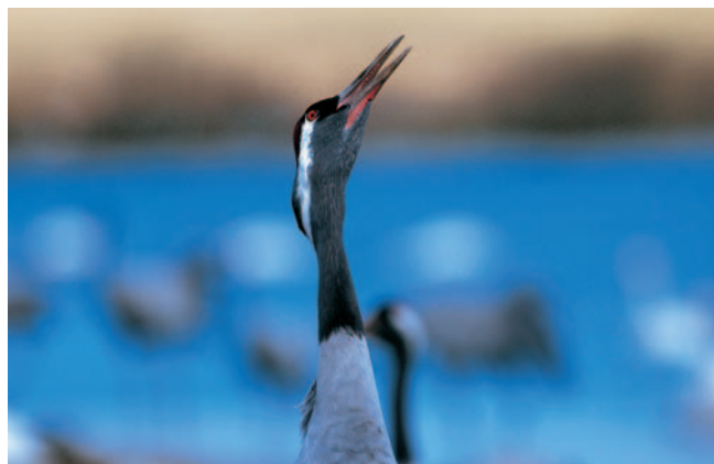
L'impact de cette photo de grue qui chante doit beaucoup à l'arrière-plan. Les couleurs s'harmonisent et même si le fond n'est pas « gommé », il ne gêne pas le sujet principal.

fois plus éloigné qu'avec un 500 mm pour obtenir l'« effet gommé ». La distance appareil/sujet influe elle aussi sur le rendu de l'image : une mise au point à courte distance diminue la zone de netteté et augmente l'effet flou du fond. Les boîtiers qui possèdent un testeur de profondeur de champ permettent de visualiser dans le viseur ce que sera le rendu final.