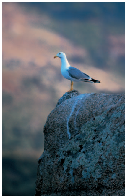
Goéland leucophé. Les teintes des rochers recouverts de lichens rappellent celles du dos de l'oiseau. Ici, le sujet est dans le tiers supérieur de l'image.

illustrera parfaitement le manque d'espace. Mais se lancer dans des cadrages inattendus implique de bien maîtriser les bases classiques de la composition.